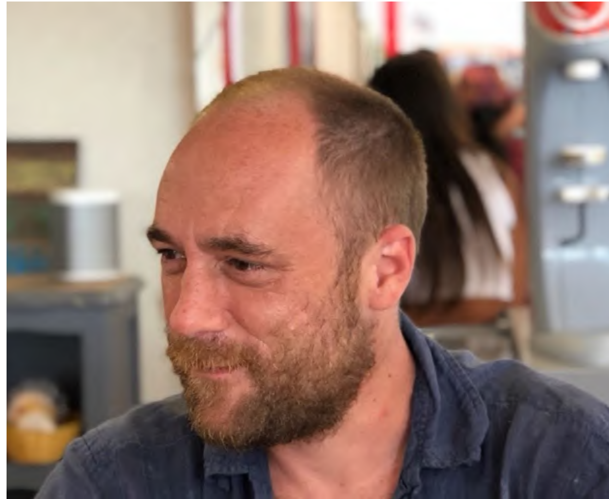
CARLO DALLA CHIESA