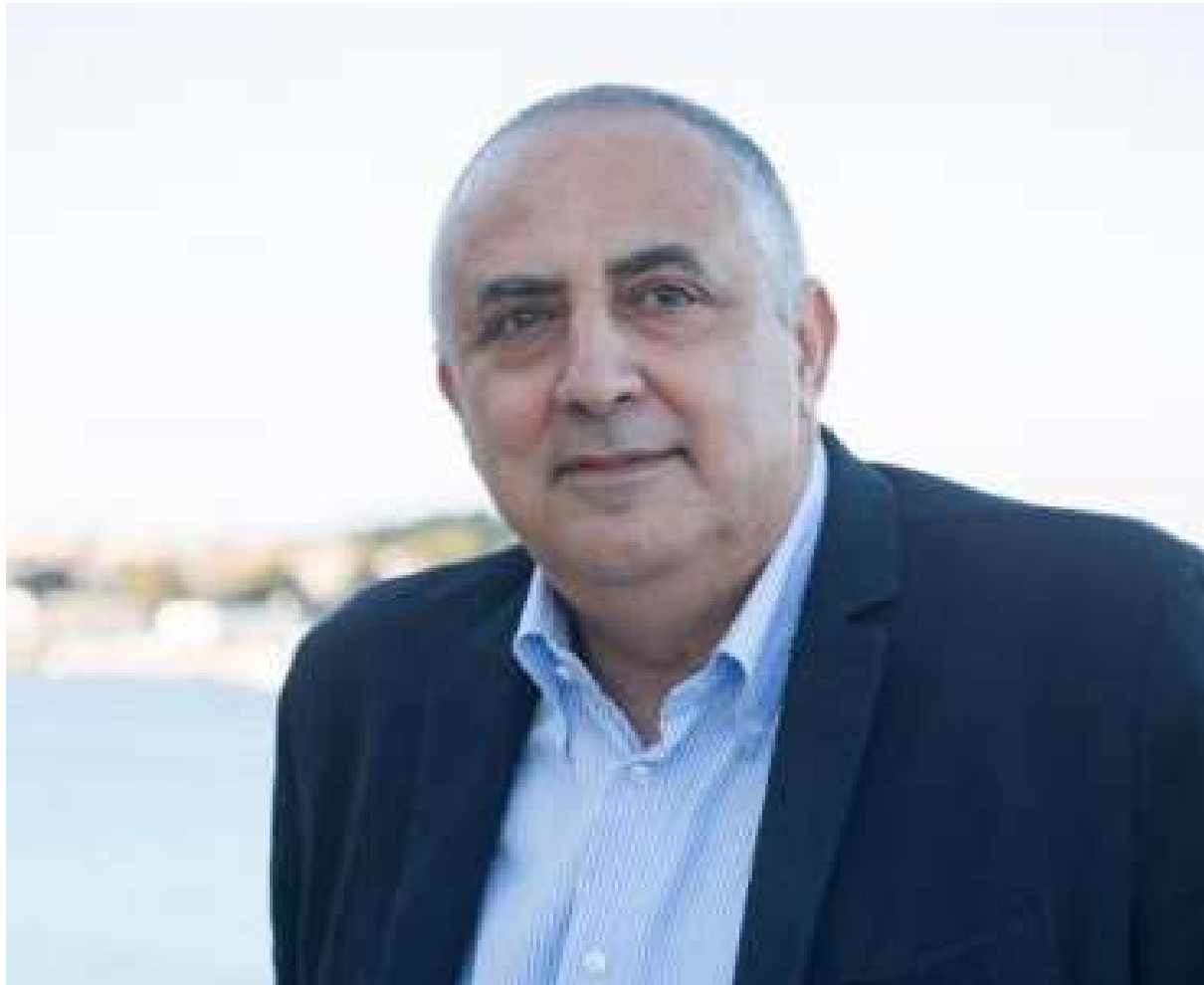
ROBERTO LAGALLA Sindaco di Palermo