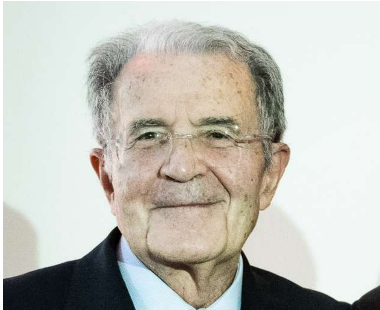
ROMANO PRODI Ex Presidente del Consiglio dei Ministri della Repubblica