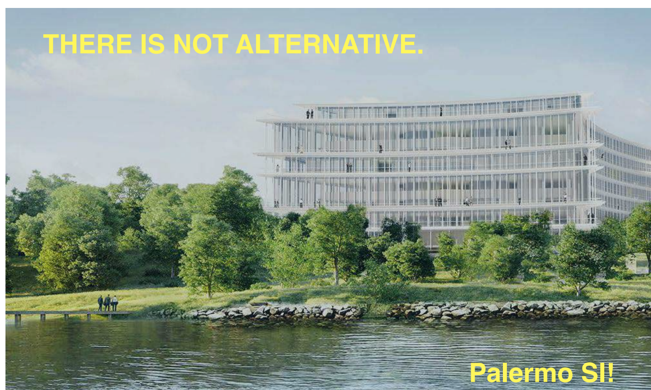
Herzog & De Meuron

Palermo 2022. Dare forma ad un nuovo orizzonte è possibile.